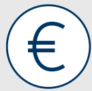
ABBILDUNG 4: KERNERGEBNISSE – MEHRUMSÄTZE DER PRIVATVERSICHERTEN IN RHEINLAND-PFALZ