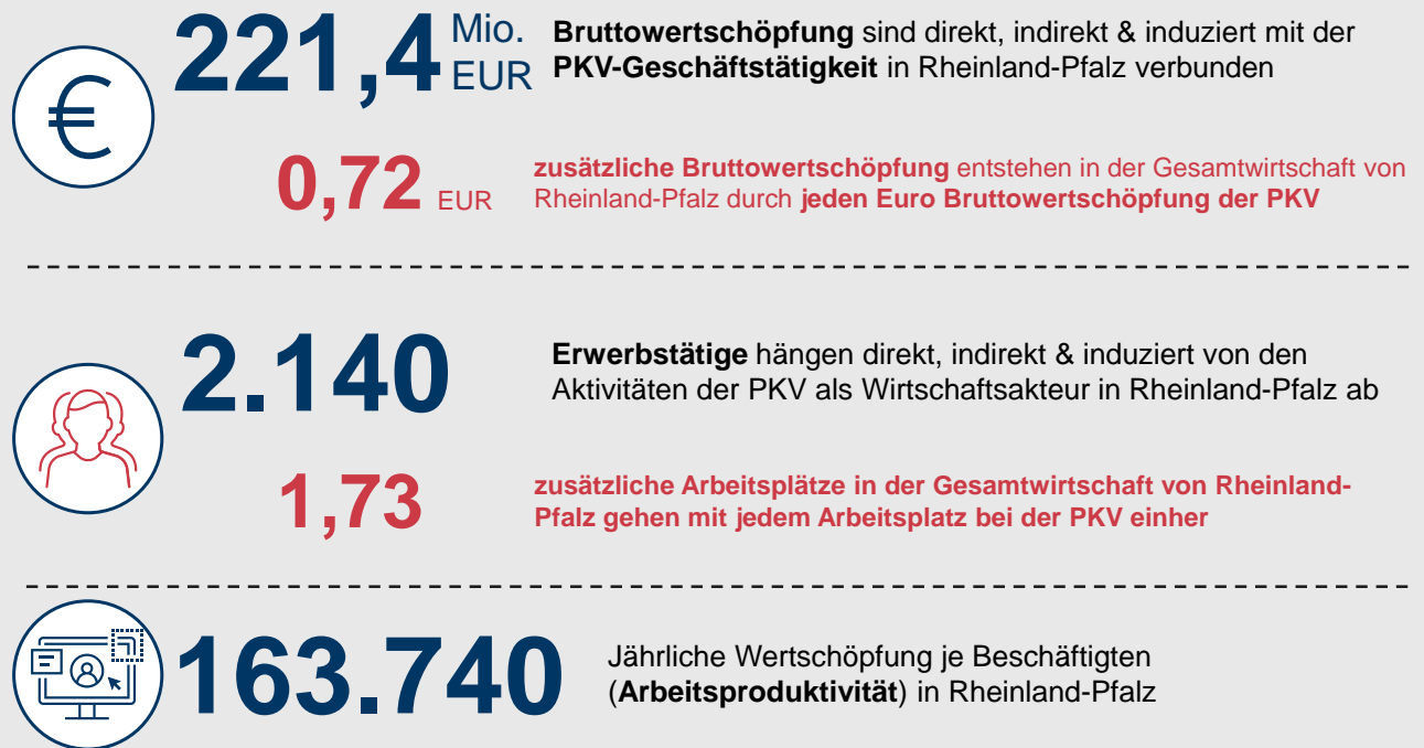
ABBILDUNG 2: KERNERGEBNISSE – PKV ALS WIRTSCHAFTSAKTEUR IN RHEINLAND-PFALZ