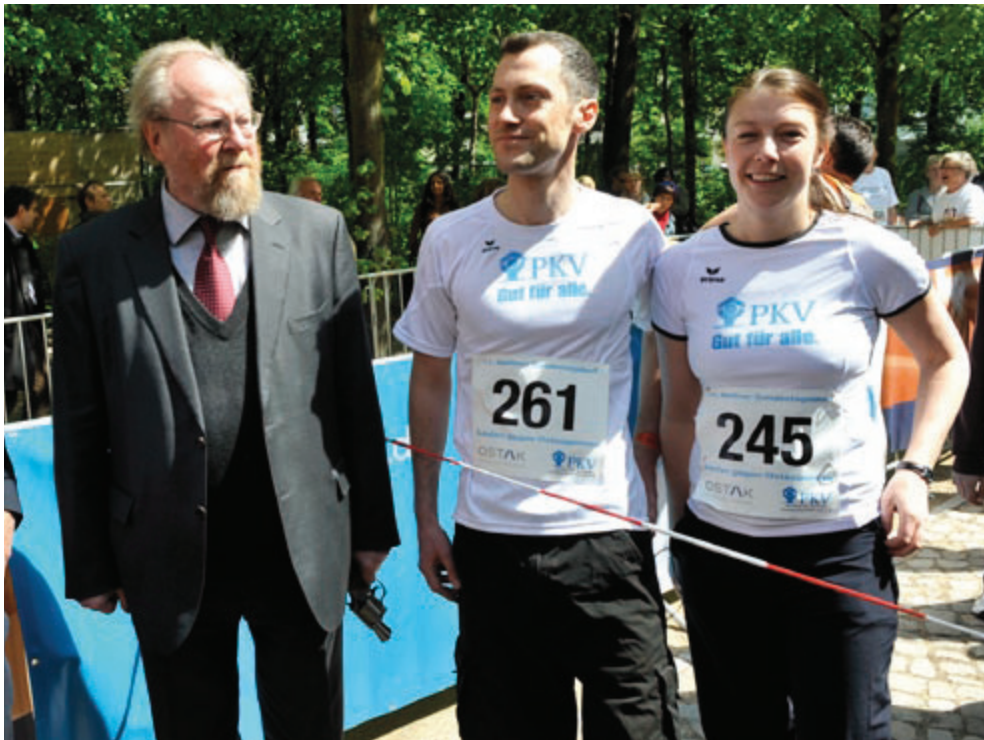
Zwei Mitarbeiter des PKV-Verbandes warten beim 11. Bundestagslauf im Mai auf den Startschuss durch Bundestagsvizepräsident Wolfgang Thierse. Die PKV ist Sponsor des jährlichen Bundestagslaufes, bei dem sich Aktive aus Politik und Verbänden über die Distanzen 3,6 und 7,2 Kilometer messen.