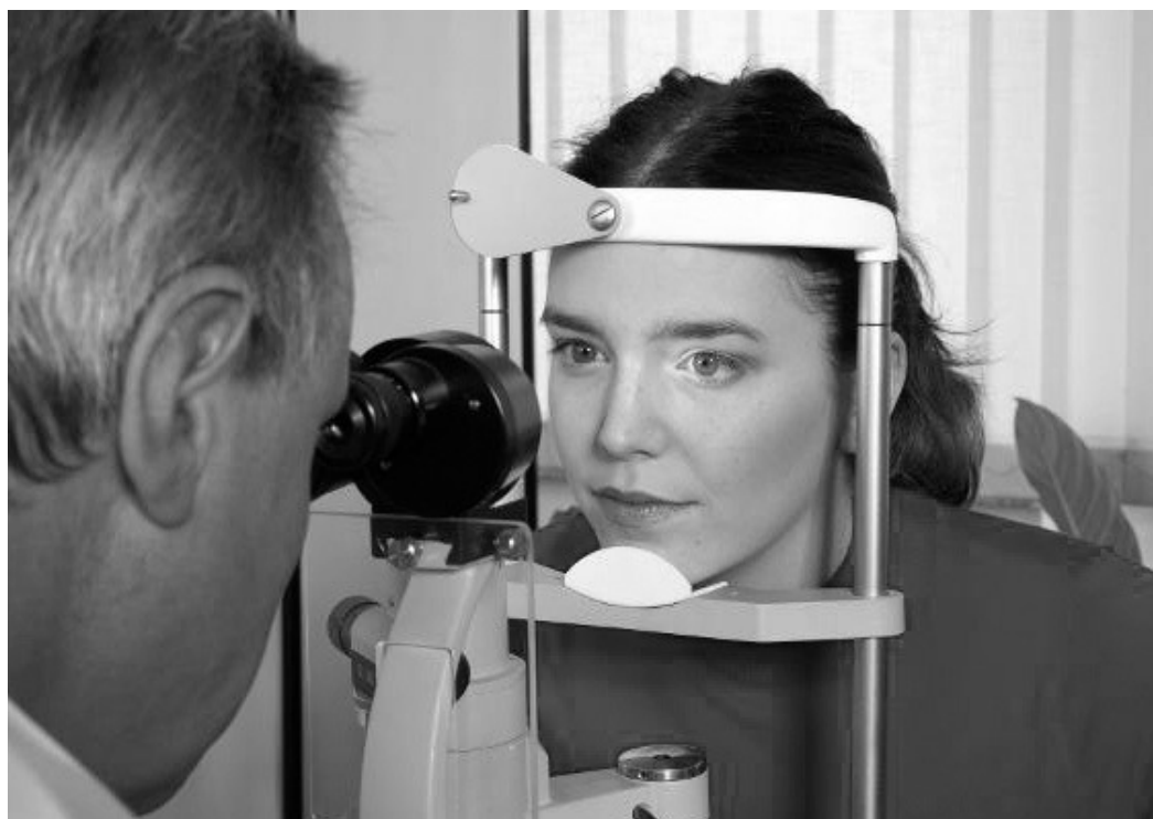
Der größte Teil des Mehrumsatzes der privat Versicherten entfällt auf die Arzthonorare.

Die ausführliche Fassung der Studie findet sich im Internet unter www.wip-pkv.de .