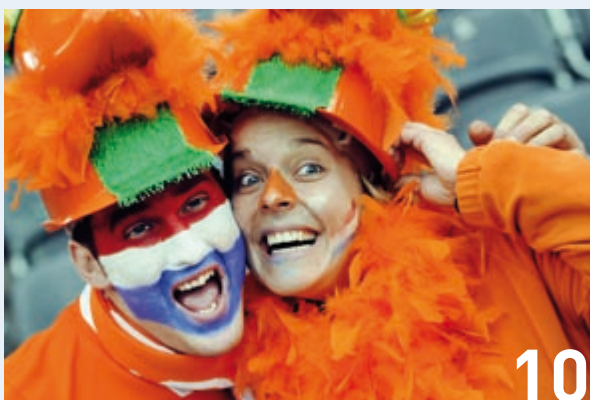
Die Niederländer: günstiger versorgt, weil im Schnitt jünger