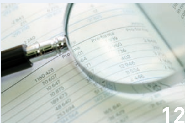
Freiwillig GKV-Versicherte: strengere Kontrolle aller Einkünfte